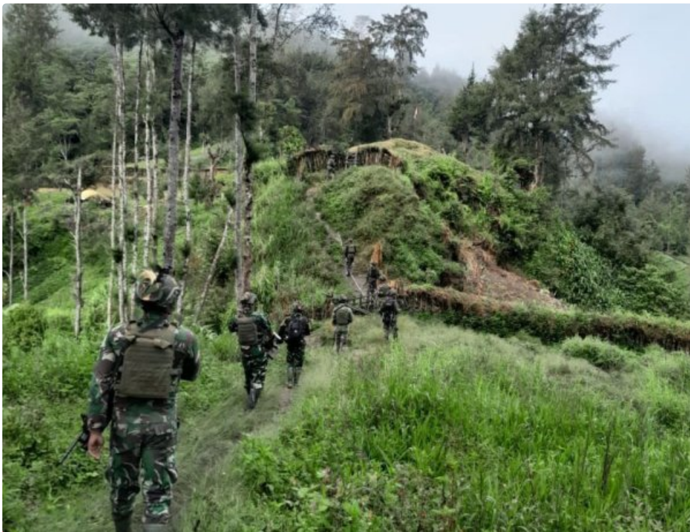
Satgas Mobile Yonif 323 Buaya Putih Berhasil Lumpuhkan Toko OPM

Insiden terjadi saat pasukan Satgas Yonif 323 Buaya Putih Kostrad melaksanakan patroli untuk menjaga keamanan di sektor wilayah