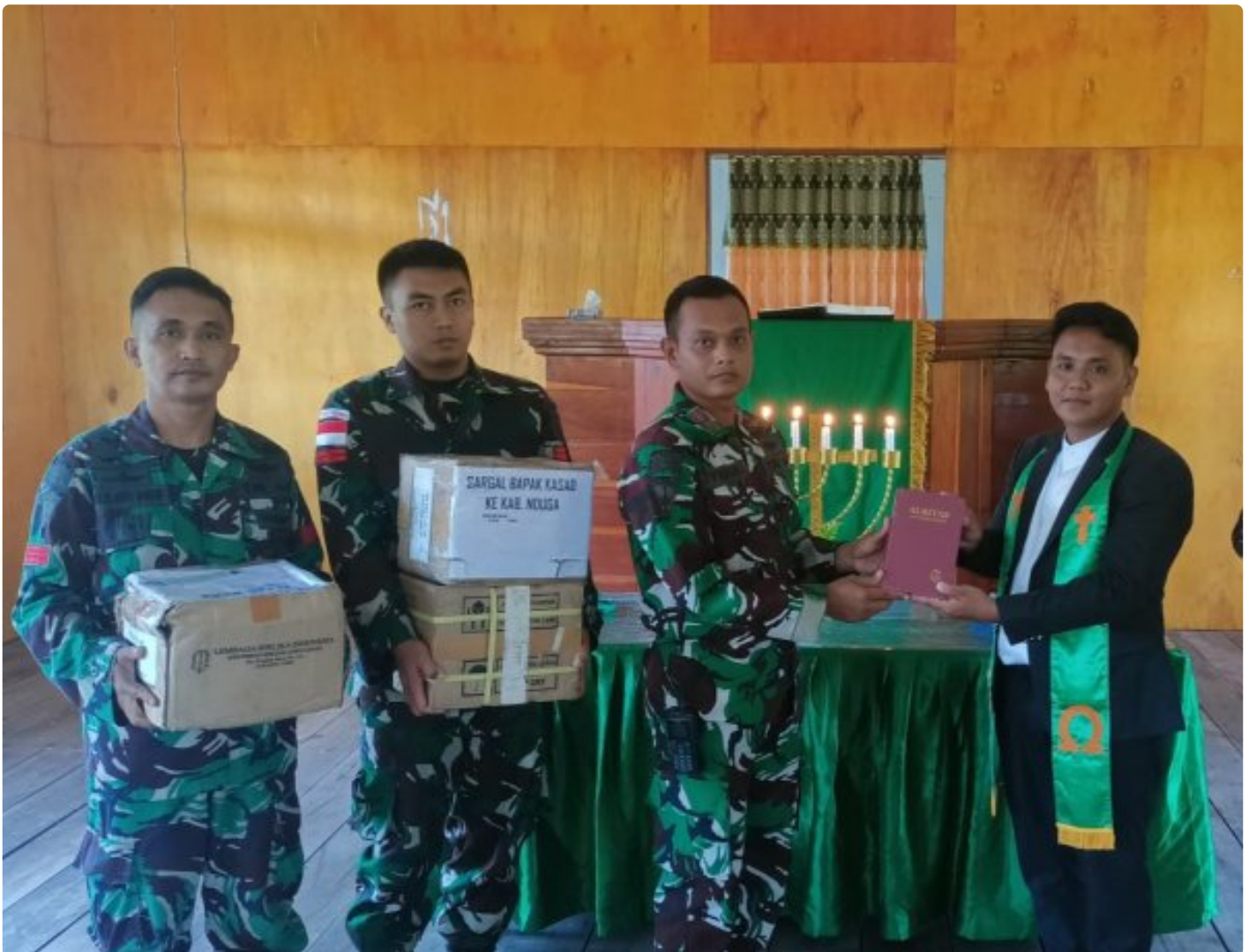
Foto: Satgas Yonif 503/Mayangkara kembali menunjukkan dedikasinya kepada masyarakat di Papua dengan memberikan dukungan alat musik untuk kegiatan ibadah di Gereja GKI Bethesda Batas Batu, Distrik Krepkuri, Kabupaten Nduga. Pada Minggu, 12 Januari 2025.